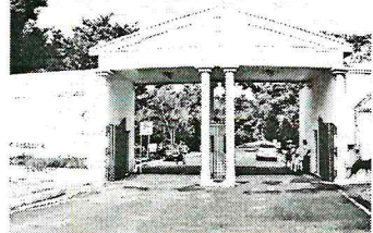
PORTÃO DE ENTRADA do Parque Zoobotânico