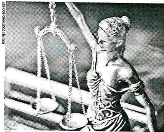
JUSTIÇA determinou indenização para empresa