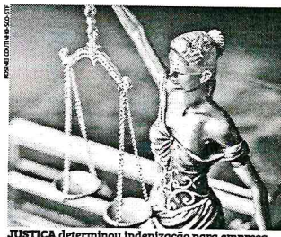
JUSTIÇA determinou indenização para empresa