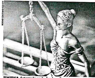
JUSTIÇA determinou indenização para empresa